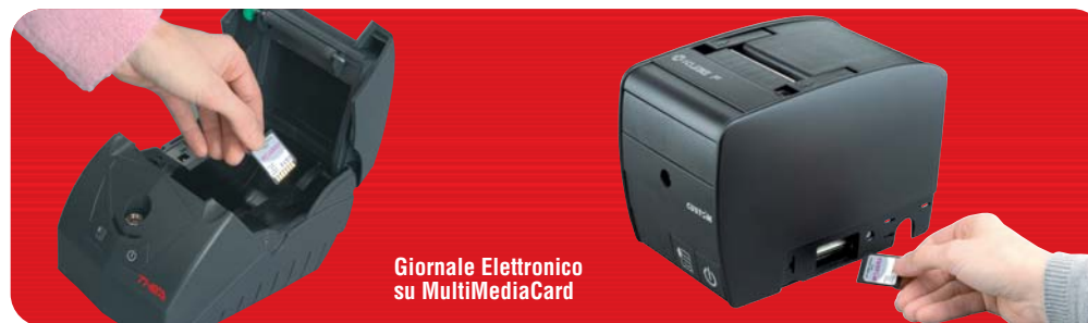
Giornale Elettronico su MultiMediaCard

Le stampanti fiscali Custom sono dotate di driver OPOS, JavaPOS, Libreria fiscale proprietaria (DLL), protocollo bidirezionale Custom, protocollo xon-xoff e di un pratico tool di installazione, programmazione e manutenzione della stampante da PC.